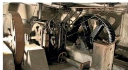
Page de gauche : la gare basse du funiculaire, qui a bénéficié d'une restauration, est ouverte au public.