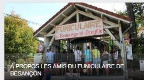
À PROPOS LES AMIS DU FUNICULAIRE DE BESANÇON